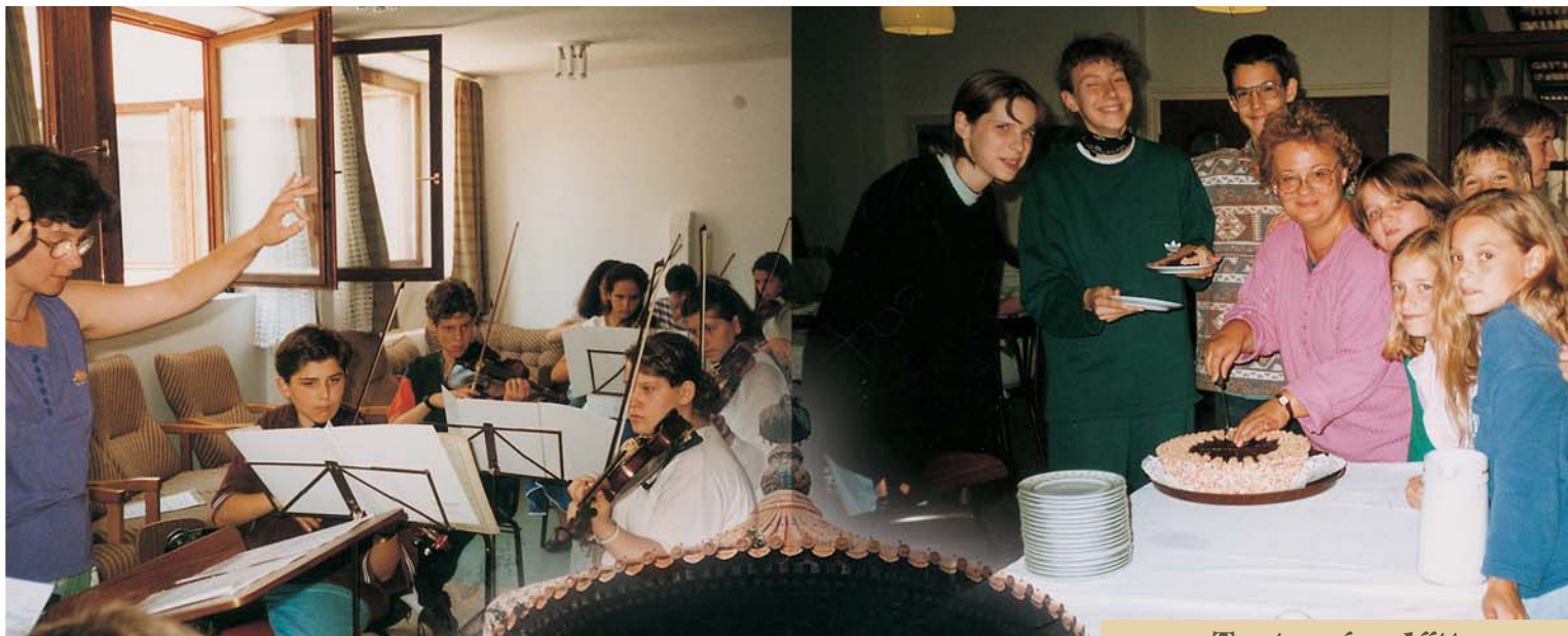
Próbál az ifjúsági zenekar