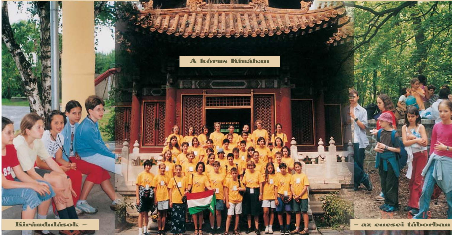
A kórus Kínában