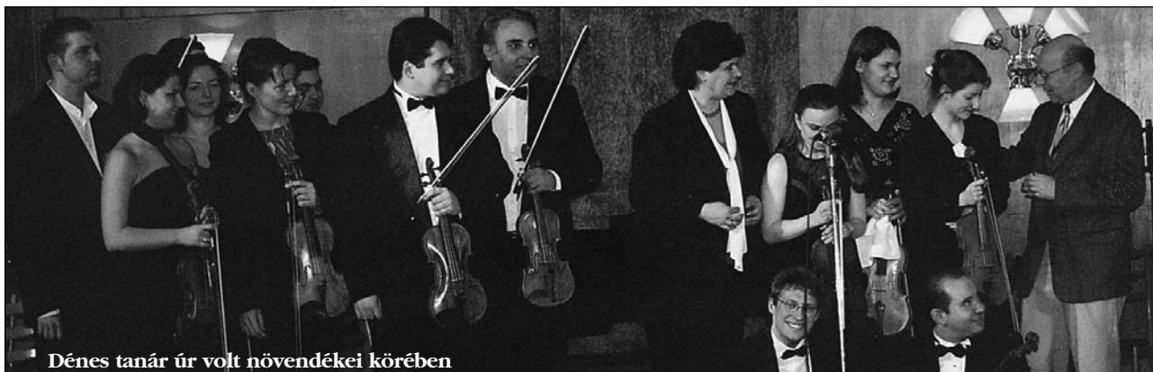
Dénes tanár úr volt növendékei körében

tanszakvezető hegedűtanár fővárosi szaktanácsadó