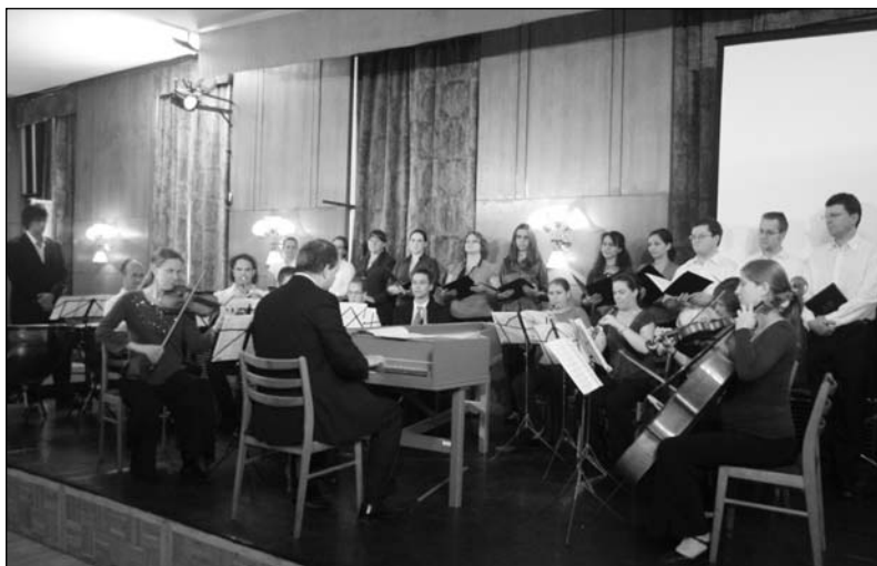
Purcell: Come, Ye Sons of Art