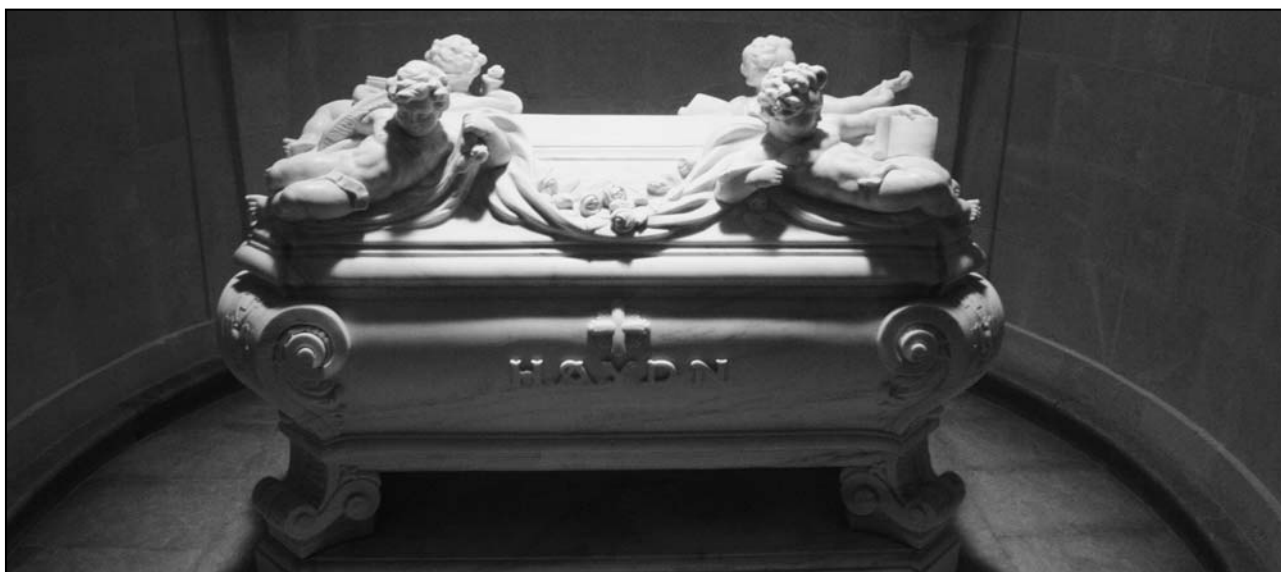
Haydn szarkofágja a Haydn-mauzóleumban

Esterházy Pál kismartoni (ma Eisenstadt) rezidenciájának másod-, majd (1766-tól) első karmestere lett. Közben a család új feje, Esterházy (Pompakedvelő) Miklós herceg új kastélyt építtetett a Soprontól 26 km-re fekvő Sütőtörön, melyet 1766-tól kezdve Eszterházának hívtak (1950 óta Fertőd). A kastélyt hamarosan a Versailles-i kastély magyar másának tekintették az idelátogató külföldiek, s ahol az udvartartásban kiemelt szerepet kapott a zene. Eszterházán marionett-színház, operaház működött, s az idelátogató diplomaták és főúri vendégek hangversenyeket, kamarazenei estélyeket is hallgathattak, melyeken gyakran – kiváló barytonjátékosként – maga a herceg is részt vett. A zenei élet kulcsfigurája azonban kétségtelenül az udvari együttesek vezetője Haydn volt, aki zeneszerzőként, karmesterként egyaránt a legmagasabb igények szerint teljesítette feladatát. A keze alatt működő zenekar Európa egyik legjelentősebb együttesévé vált, nem véletlenül jelentette ki a kastélyban több alkalommal is megforduló Mária Terézia császárnő, hogy „aki igazán jó operaelőadást akar hallani, Eszterházára kell utaznia” .