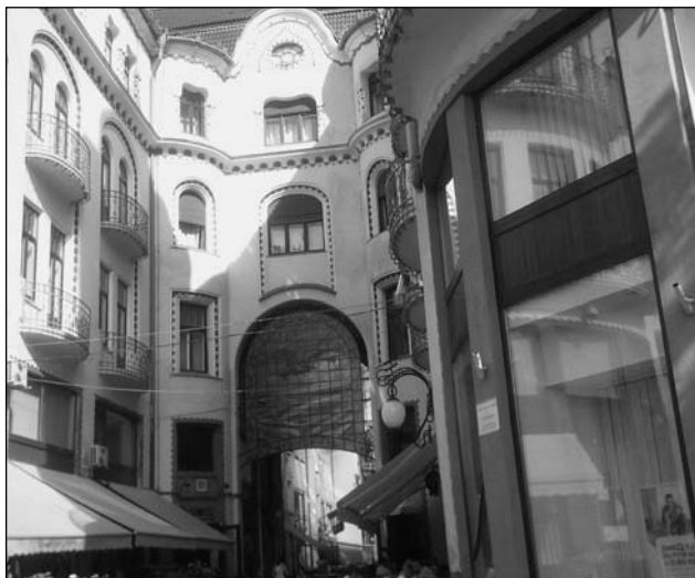
A Sas palota