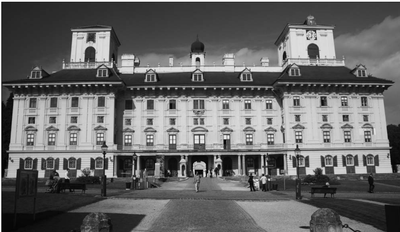
Esterházy kastély – Eisenstadt

Kétségtelen persze, hogy Haydn útja egyáltalán nem volt könnyű. Ő maga írja egy helyen, hogy gyerekként, első tanulmányai idején több verést kapott, mint ételt. Miután 17 éves korában kikerült a bécsi Stephansdom kórusából, kilenc éven keresztül alkalmi munkából tartotta fenn magát, s tanulmányait csak saját erejéből, főként más mesterek műveinek elemzésén keresztül folytathatta. A sok koplalás és nélkülözés még több munkára sarkallta, s mindez meghozta az eredményét: 1758-ban Morzin gróf udvari zeneszerzője lett (a ma Horvátországban lévő) Lukavecen, 1761-ben pedig